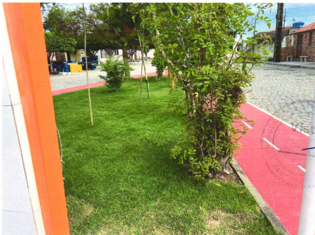
Foto 08 - Grama esmeralda em placas, fornecimento e plantio