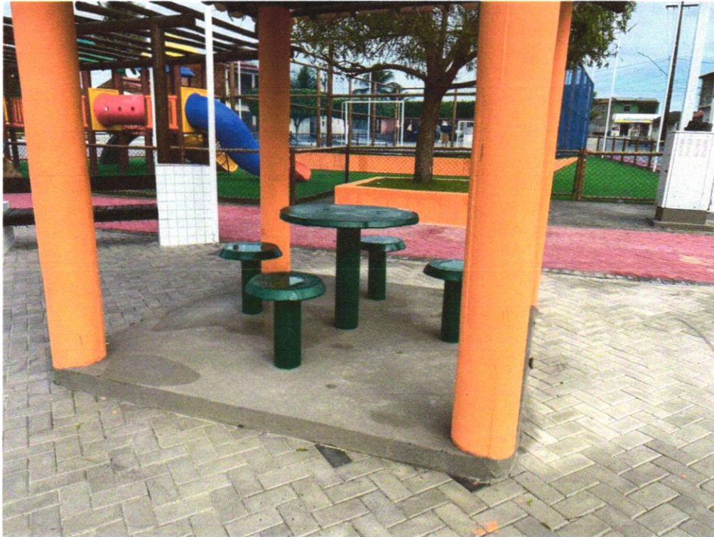
Foto 15 - Mesa c/ tampo \varnothing=1,00\text{m} em concreto armado polido sobre tubo de concreto armado \varnothing=0,40\text{m} , e 4 bancos em concreto armado \varnothing=0,40\text{m} , com pintura acrílica cor cinza grafite da Coral ou similar.