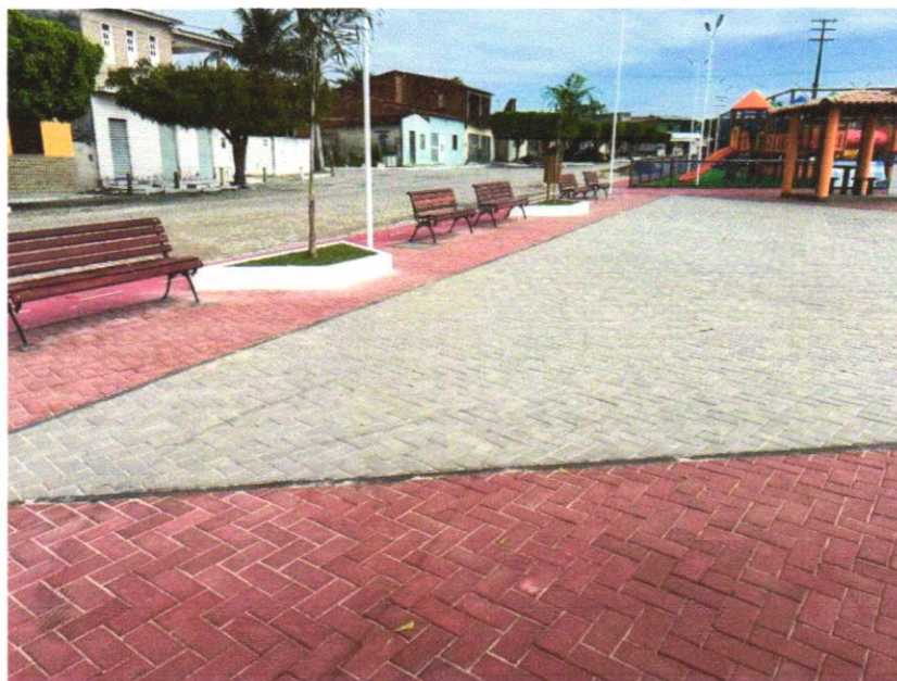
Foto 05 - Pavimentação em bloco de concreto vibroprensado, intertravado, colorido, 10x20cm, e=6cm, 46un/m 2 , NBR9781, Fck(min)=35MPa, sob coxim areia grossa compactada c/ placa vibratória, e(comp.)=6cm, rejuntado c/ areia fina.