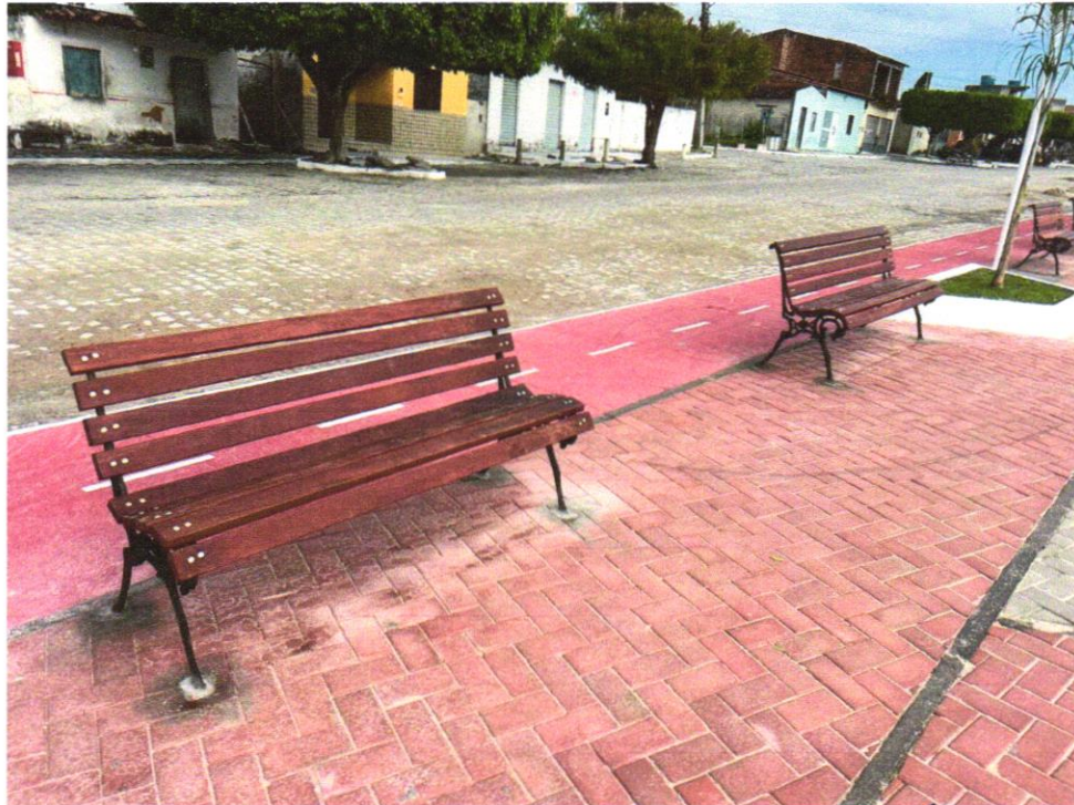
Foto 11 – Banco de madeira com encosto em eucalipto tratado (2,00X0,50)M