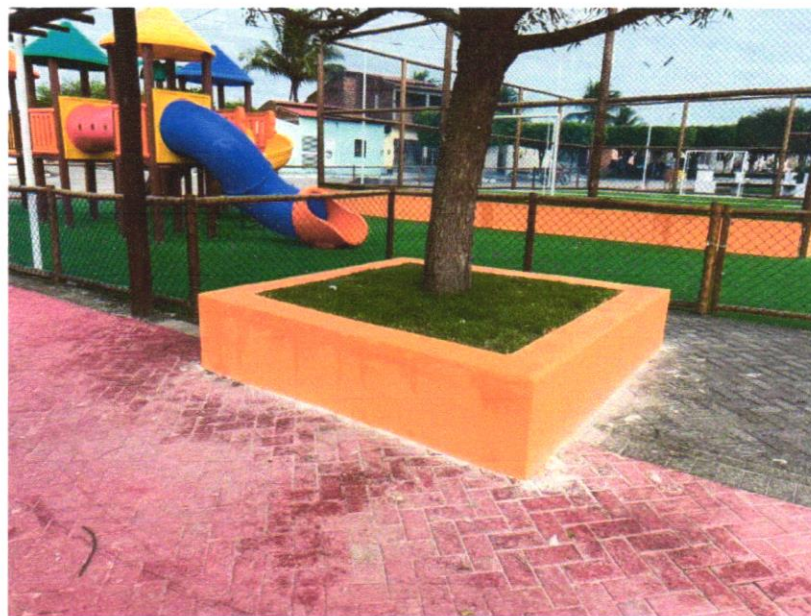
Foto 01 - MASSA ÚNICA, PARA RECEBIMENTO DE PINTURA, EM ARGAMASSA TRAÇO 1:2:8, PREPARO MANUAL, APLICADA MANUALMENTE EM FACES INTERNAS DE PAREDES, ESPESSURA DE 10MM, COM EXECUÇÃO DE TALISCAS