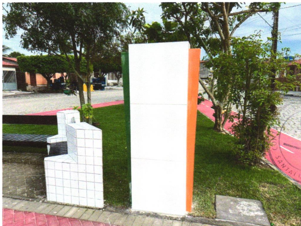
Foto 18 - TÔTEN DE INAUGURAÇÃO EM ALVENARIA