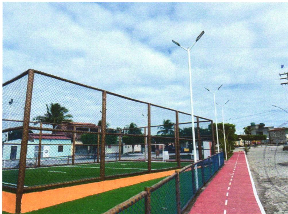
Foto 14 - QUADRA POLIESPORTIVA