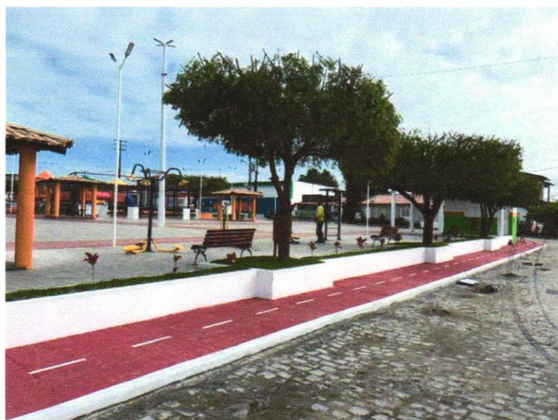
Foto 02 - MASSA ÚNICA, PARA RECEBIMENTO DE PINTURA, EM ARGAMASSA TRAÇO 1:2:8, PREPARO MANUAL, APLICADA MANUALMENTE EM FACES INTERNAS DE PAREDES, ESPESSURA DE 10MM, COM EXECUÇÃO DE TALISCAS