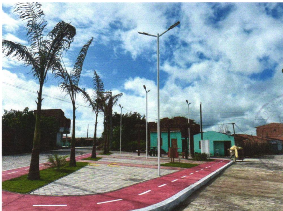
Foto 12 – Planta - Palmeira Imperial h=4,00 a 5,00 m (fornecimento e plantio)