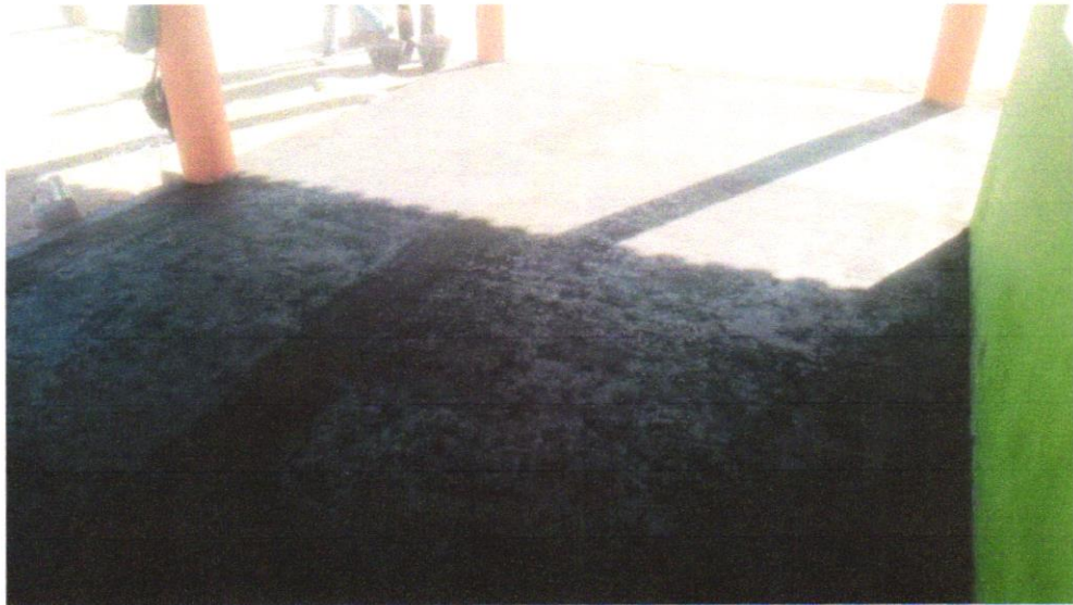
Foto 03 – PAVIMENTAÇÃO EM CONCRETO, COM ESPESSURA DE 7 CM, COM ACABAMENTO FEITO UTILIZANDO ALISADORA DE CONCRETO (HELICOPTERO), INCLUIDO TELA DE AÇO SOLDADA NERVURADA CA60, Q196 (3,11 KG/M 2 ), DIÂMETRO DO FIO 5.0 MM, LARGURA = 2,45 M, ESPAÇAMENTO DA MALHA = 10 X 10 CM, JUNTA DE DILATAÇÃO EM PVC A CADA 2,00 M, CONCRETO FCK = 20 MPA