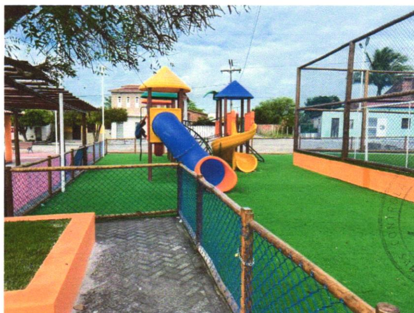
Foto 06 - FORNECIMENTO E MONTAGEM DE CERCA DE PROTEÇÃO EM EUCALIPTO CLOEZIANA TRATADO A BASE DE CCA EM AUTOCLAVE, COM APLICAÇÃO DE STAIN NA COR NATURAL COM DUPLO FILTRO SOLAR, DIAMETRO DO EUCALIPTO DE 6 A 8 CM, COM ANTI-RACHA NA EXTREMIDADE. FECHAMENTO COM TELA DE ALAMBRADO FIO Nº 12 REVESTIDO DE PVC, MALHA 2.1/2 X 2.1/2", FIXADO COM FIO Nº 14 REVESTIDO EM PVC, MÓDULO MEDINDO 1,50 X 1,00M, PARAFUSOS GALVANIZADOS COM TRAVAMENTO CLICKFIX, CONFORME PROJETO

Evaldo Almeida Moraes Engenheiro Civil RNP 051417303-3