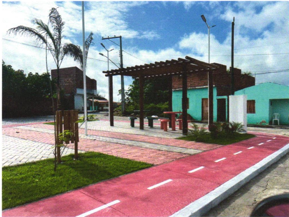
Foto 07 - PERGOLADO