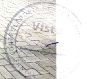
Foto 04 – Pavimentação em bloco de concreto vibroprensado, intertravado, cor natural, 10x20cm, e=6cm, 46un/m 2 , NBR9781, Fck(min)=35MPa, sob coxim areia grossa compactada c/ placa vibratória, e(comp.)=6cm, rejuntado c/ areia fina.

Evaldo Almeida Moraes Engenheiro Civil RNP 0514117303-3