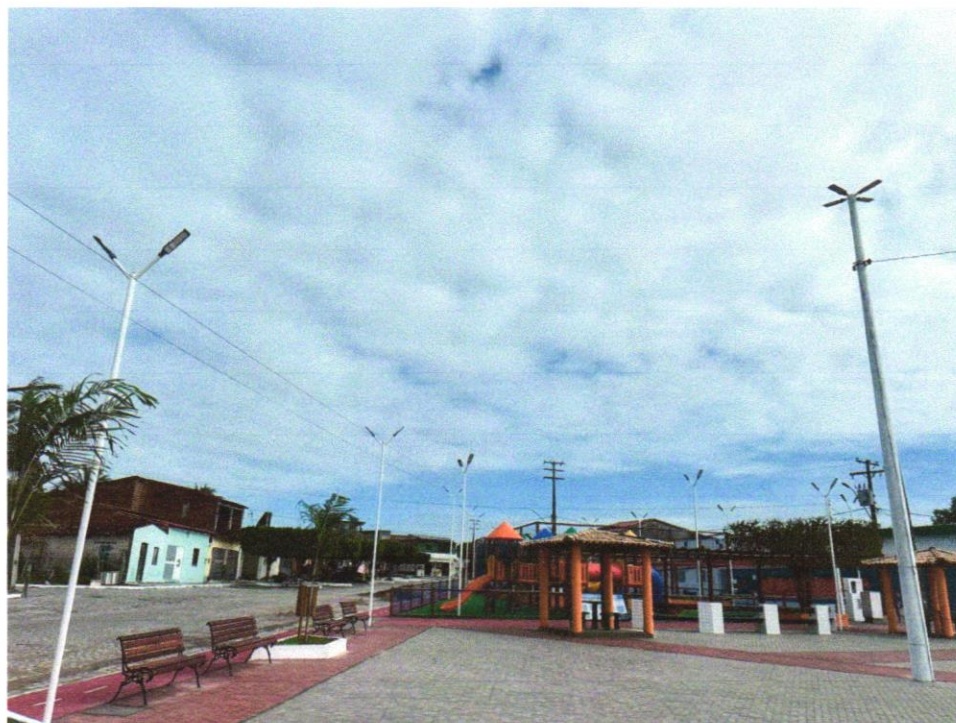
Foto 17 - Postes