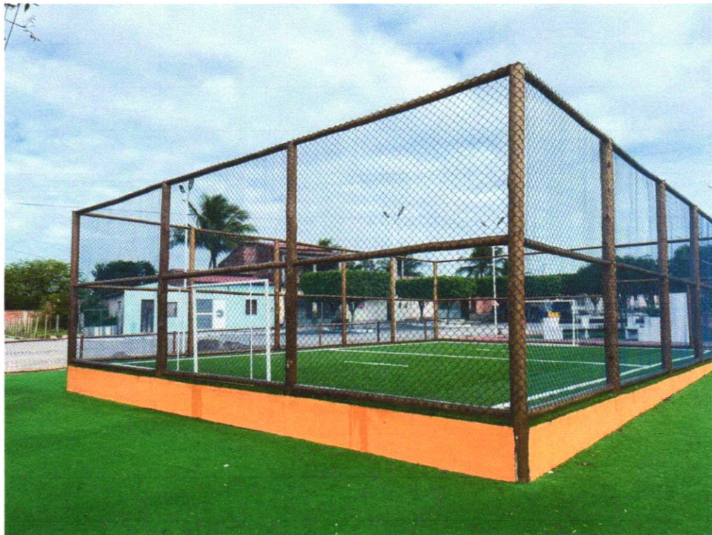
Foto 09 - FORNECIMENTO E INSTALAÇÃO DE GRAMA SINTÉTICA COM ALTURA MAIOR OU IGUAL A 20 MM